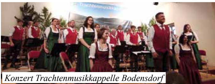
Konzert Trachtenmusikkapelle Bodensdorf