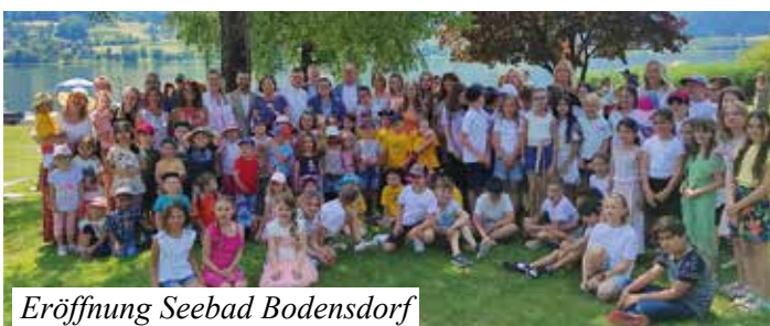
Eröffnung Seebad Bodensdorf