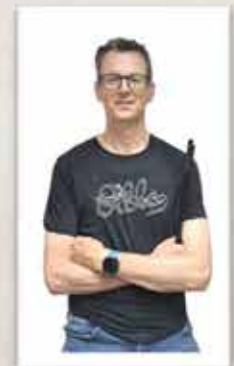
Grünanger Siegbert Schlagwerk