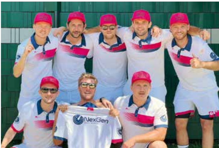
SCO-5. Klasse Herren